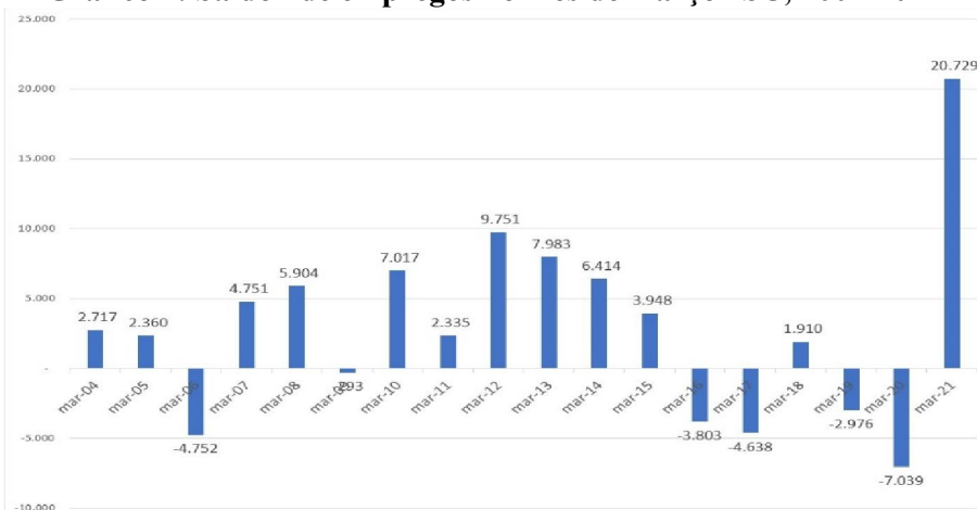
Gráfico 1: Saldo l de empregos no mês de março– SC, 2004-2021

Fonte: CAGED e Novo CAGED– SEPRT/ME; Elaboração: Diretoria de Emprego e Renda – DIER/SDE.